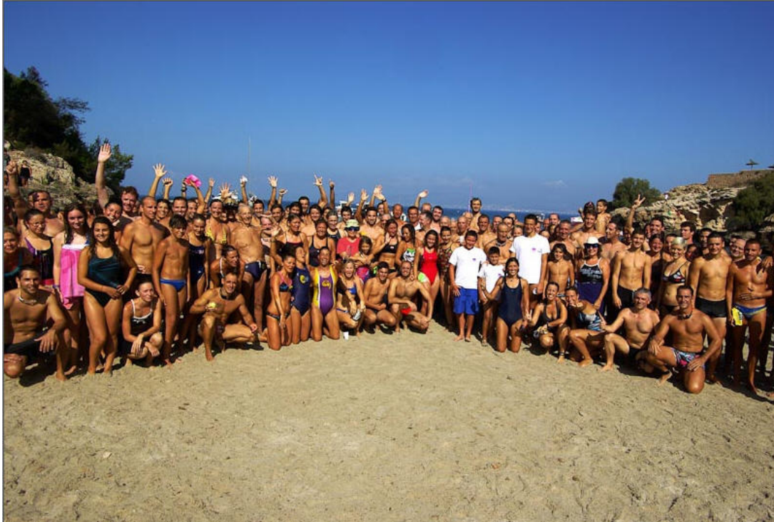
Participantes IX Sa Milla (agosto 2012).

Gracias por participar y disfrutad de esta bonita travesía.