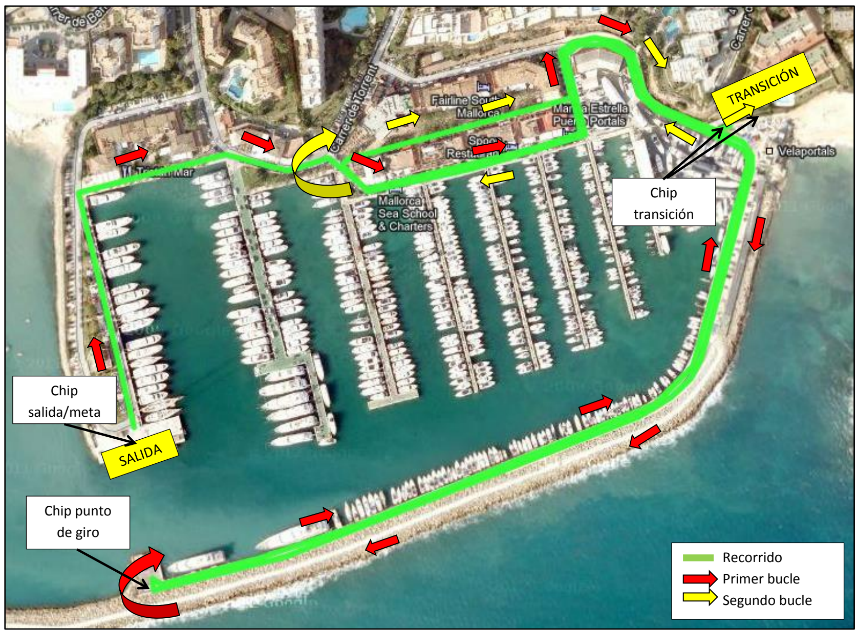
Mapa 1. 3000 m. para primer segmento de carrera a pie.